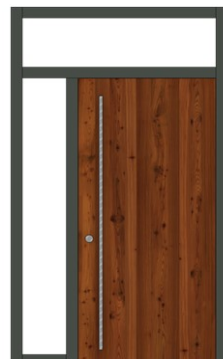
mit Seitenteil + Oberlicht