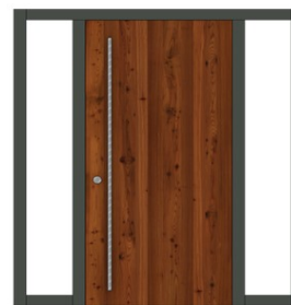
mit 2 Seitenteilen