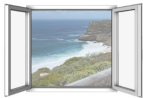
2-flügelig ohne Pfosten