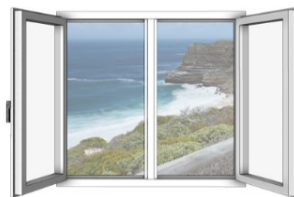
2-flügelig mit Pfosten