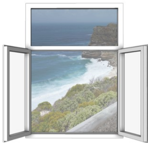
3-teilig mit Oberlicht