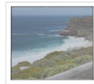
Festverglasung (nicht zu Öffnen)